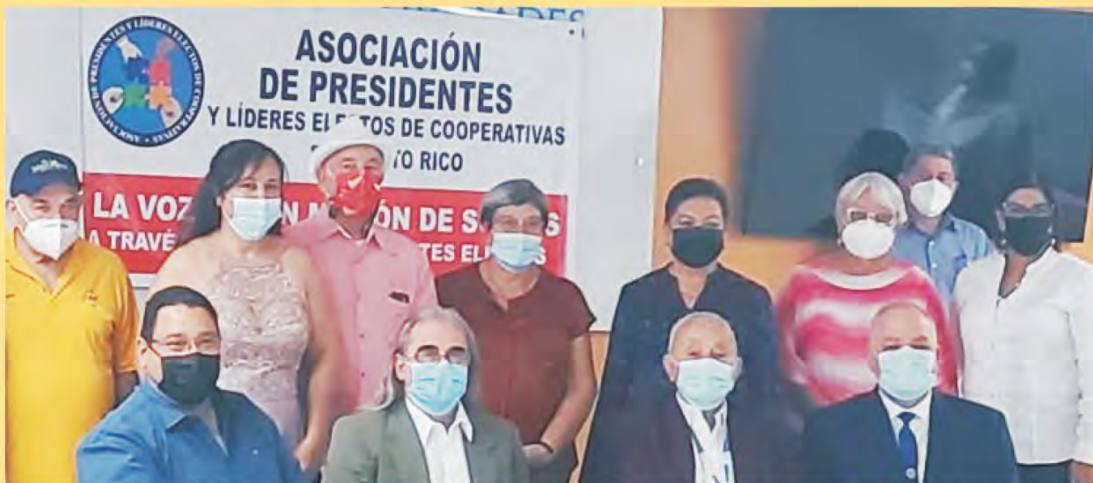
Fundadores de la Asociación de Presidentes y Líderes Electos de las Cooperativas.

emigración del ejército de desempleados del pueblo. Hoy día solo la ATH de Caribe Coop sirve al pueblo. Muchos arguyen que para sobrevivir el movimiento cooperativo tiene que modernizarse y se llenan la boca con el internet. La gran mayoría de nuestros socios no tienen internet, me atrevo a decir que casi el 70%. La otra realidad es que la sociedad puertorriqueña ha envejecido, así como el cooperativismo. Vaya a una asamblea y verá quien se postula y sale electo. Los miembros de la junta somos mayoritariamente retirados de la tercera edad. Pregunte cuál es el incentivo para desear ser elegido a la junta. El trabajo es voluntario, está obligado a tomar seminarios y puede ser demandado. ¿Cuál es el salario recibido por ser parte de la junta? Adivinó: cero. No estoy en contra del internet ni contra el progreso. De hecho he votado a favor de todas las medidas que se presentan para que la tecnología mejoren los servicios y ayuden a los socios. Solo recuerdo un merengue de aquéllos que bailábamos en la Logia: un poquito para atrás por favor.