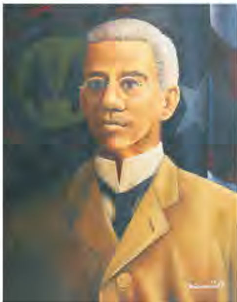
Dr. José Celso Barbosa