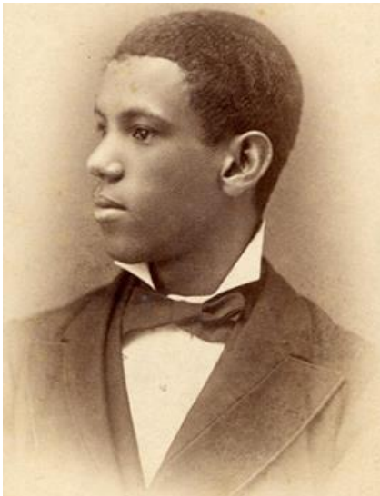
Foto de José Celso Barbosa (1880)

Michigan